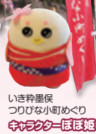
いき粋墨侯 つりびな小町めぐり 中央ラクターぽぽ姫

巡り先26か所に人形のぽぽ姫(5体)を展示。3体以上みつけた方に粗品を進呈。和服の参加者には和服小町賞を進呈。