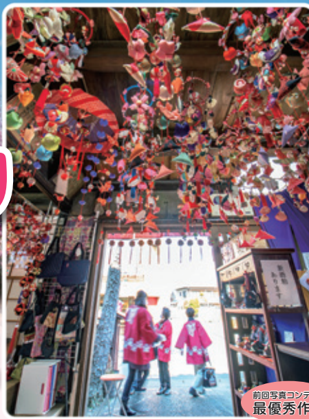
前回写真コンテスト 最優秀作品