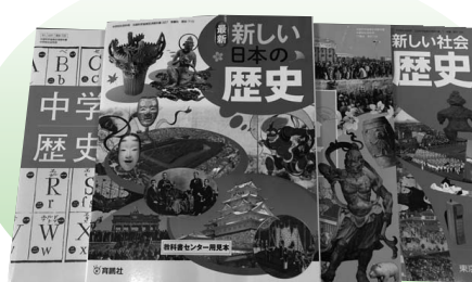
中学校の歴史の教科書

答 教科書の選択結果と理由については、西濃地区採択協議会が、規定に従い公表する。調査・研究・協議の内容は、9月1日以降に公表される。