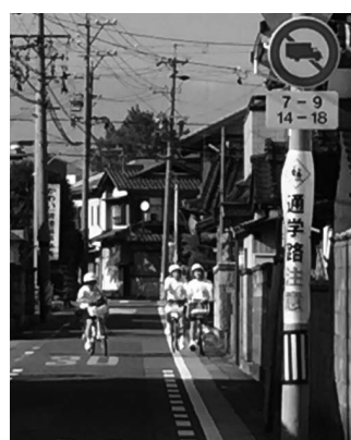
中学生の下校の様子

答 感染が心配で、学校再開後も欠席者が小・中学生合わせて3人いたが、丁寧に説明。2人は通常登校。1人は放課後登校をしている。今現在は、ストレスや不安を訴える生徒は少なく、落ち着いて生活している。一斉授業が始まる6月15日以降、2回目の「心のアンケート」を実施し、きめ細かな支援を継続的に実施する予定。