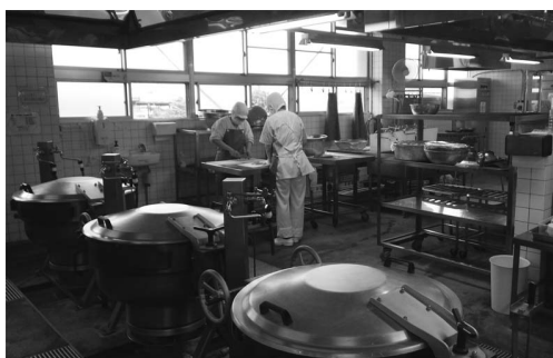
町内小学校の給食室

答 築年数は平均35年。施設維持管理には苦慮している。今後、小規模な改修で、長寿命化を図るか、将来的な学校統合や給食施設の集約を図るなど、調査を進め検討していく。