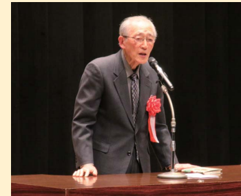
平成30年度 愛の詩発表会にて

「親孝行のふるさと」としての養老町を全国に広く発信し町民が郷土に誇りを持つことに寄与された功績をたたえ特別賞を贈ります。