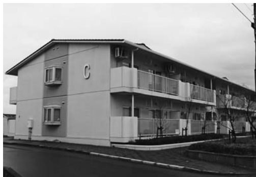
〈町営岩道住宅A・B・C棟〉

場所 岩道458番地 戸数 13戸 (A棟4室・B棟6室・C棟3室) 建設年度 A棟(平成9年度)、B棟(平成12年度)、C棟(平成15年度) 構造 中層耐火構造3階建・一戸当たりの面積78㎡(3DK) 家賃 5万5千円(収入に応じて負担調整あり) 敷金 家賃の3カ月分