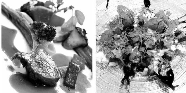
森のごちそうフェア提供料理イメージ

県では、ぎふジビエ(シカ、イノシシ)を「森のごちそう」と名付けてPRしています。