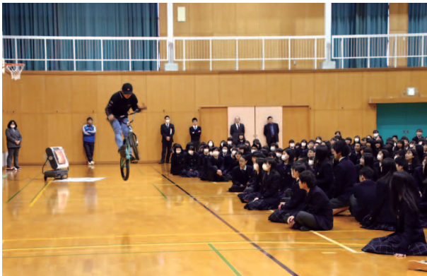
世界レベルの技を披露