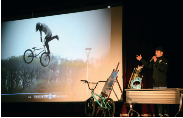
映像を使った自己紹介

講演では、この春卒業する3年生に向けたメッセージを、自身が経験したことを踏まえお話し、夢に向かって取り組むことの大切さ、大変さを語りました。また、全校生徒の手拍子の中、BMXの技を次々に披露し、大歓声を受けていました。