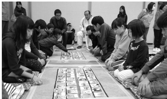
緊張のなか白熱するかるた大会

全国より多数の応募がある「家族の絆・愛の詩」募集事業について、親子教室を開催することにより、近年増加傾向にある町内からの応募をさらに増やし、「親孝行作文」とともに親孝行の心について考える機会の増加に努めます。