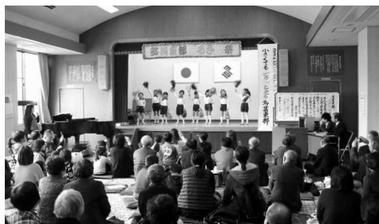
地域みんなで楽しむ公民館まつり