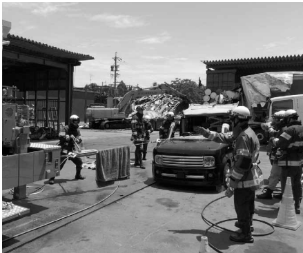
資機材取扱いの様子

この訓練は、交通事故発生時に負傷者が車内から出られない場合を想定し、迅速に救助資機材を取扱えるように、訓練を行いました。終了後には、隊員間で意見交換し、出動に備えました。