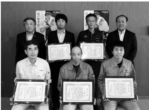
優良表彰受賞の皆さん