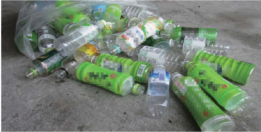
※ 正しく分別されていないペットボトル(例)