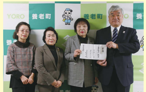
柏淵副町長に目録を渡す町生活学校第2班の皆さん