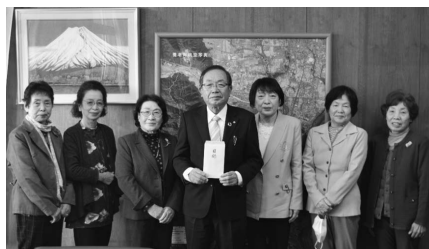
目録を渡す町生活学校第2班の皆さん