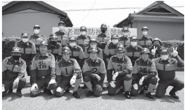
県大会に出場する北部ブロックの団員

6月19日(日)に町中央公民館駐車場にて「養老郡消防操法競練会」を開催しました。