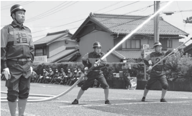
素早く操作を行い、良いタイムを目指しました。