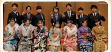
養老町はたちの集い実行委員会メンバー